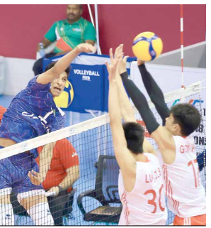
بلندقامتان جوان ایران بر بام آسیا تیم والیبال ایران برای هشتمین بار به عنوان قهرمانی قاره دست یافت