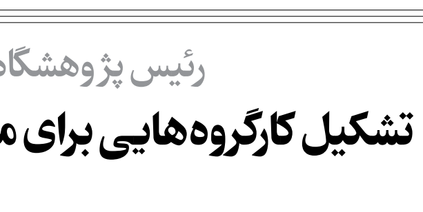
رئیس پژوهشگاه میراث فرهنگی و گردشگری از تشکیل کارگروه مبارزه با گنج‌یابی و حفاری‌های غیرمجاز با حضور متخصصان خبر داد و گفت: برای مقابله با آثار مخرب فرونشست و بلایای طبیعی نیز کارگروه ویژه‌ای تشکیل می‌شود.